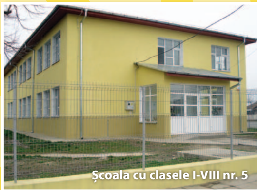
Școala cu clasele I-VIII nr. 5