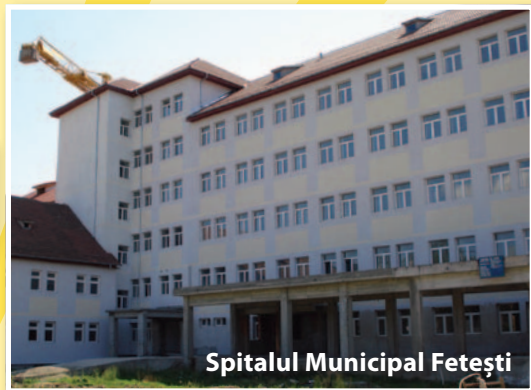
Spitalul Municipal Fetești