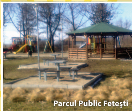
Parcul Public Fetești