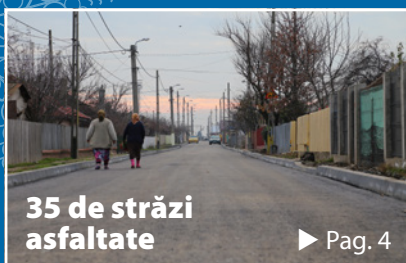
35 de străzi asfaltate ► Pag. 4