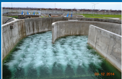
Stație de epurare și rețea de canalizare ► Pag. 2