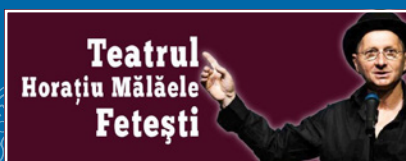
► Pag. 3