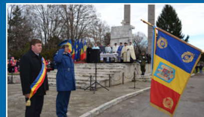
De 1 Decembrie, am spus cu toții „La mulți ani!”