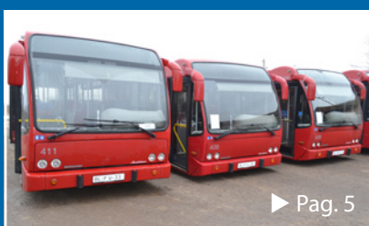
Autobuze moderne pentru transportul local feteștean ► Pag. 5