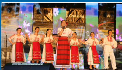
Zilele Municipiului Fetești – ediția a VIII-a