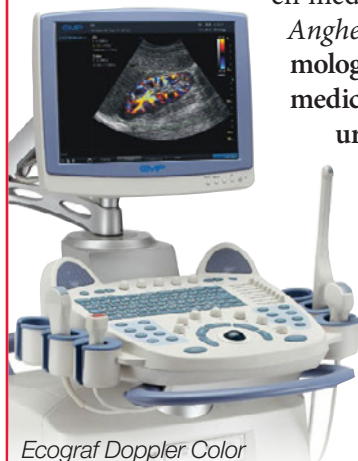
Ecograf Doppler Color

Administrația locală a făcut nenumărate demersuri pentru dezvoltarea serviciilor medicale, din 2011 când a preluat spitalul, iar începând din anul 2013 au fost înființate alte compartimente și servicii medicale la Spitalul Municipal Anghel Saligny: urologie, pneumologie, neurologie, psihiatrie, medicină internă, medicină de urgență, O.R.L., neonatologie și oftalmologie.