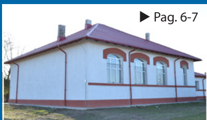
Grădinițe, școli, licee – reabilitări și modernizări ► Pag. 6-7