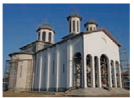
Biserica Adormirea Maicii Domnului (cartierul Coloniști)

Toate lăcașurile de cult vor fi sprijinite financiar și în 2010, astfel încât credincioșii feteșteni să se poată bucura de slujbe ținute în condiții bune, chiar de la anul.