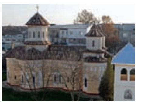
Biserica Sfinții Arhangheli Mihail și Gavriil (cartierul Fetești Gară)

Mesajul primarului către feteșteni legat de strategia pe termen mediu și lung a municipiului