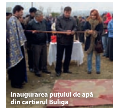
Inaugurarea puțului de apă din cartierul Buliga

Reabilitarea rețelei de distribuție a apei și extindere a acesteia în zonele nou construite a fost una dintre prioritățile primarului Gheorghe Catrinou în anul 2009. „Reabilitarea rețelei de alimentare cu apă a Cartierului Fetești Gară- etapa I” este finanțat prin